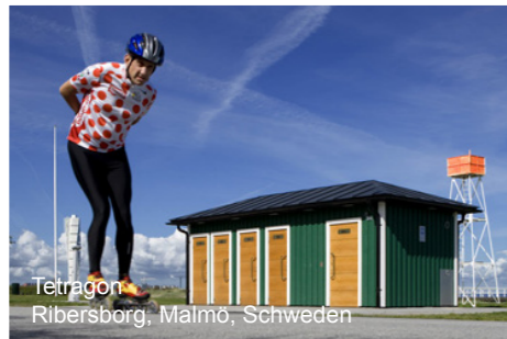
Tetrakon Ribersborg, Malmö, Schweden