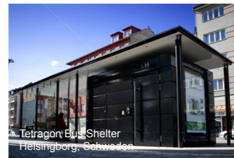
Tetrakon Bus Shelter Helsingborg, Schweden