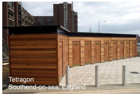
Tetrakon Southend-on-sea, England

Wie die Bilder unten zeigen, passt ein Tetrakon in sowohl städtischen als auch in Freizeit- Gebieten und bietet dabei den Besuchern einen immer wichtigeren und nachgefragten Service.