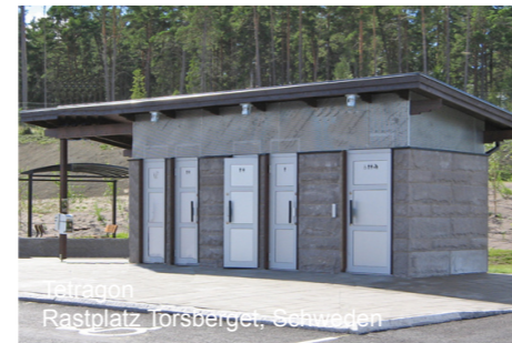
Tetrakon Rastplatz Torsberget, Schweden

Für weitere Beispiele und Anregungen für Ihr Projekt, bitte besuchen Sie unsere Online Foto-Galerie www.danfo.com .