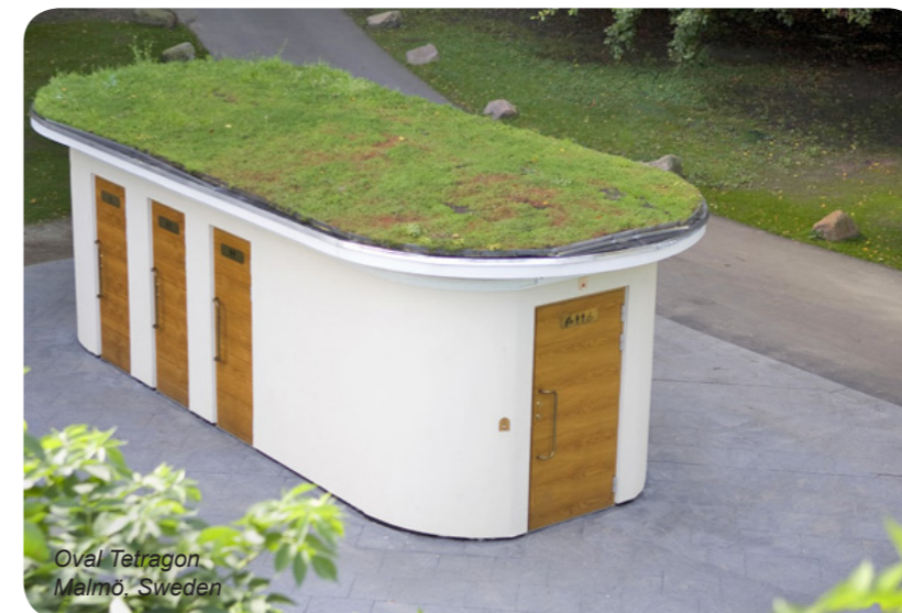
Oval Tetrakon Malmö, Sweden

Optional: Handwaschgelegenheit und Händetrockner.