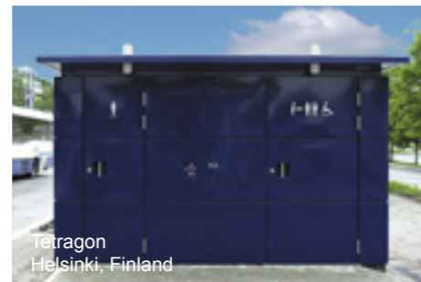
Tetrakon Helsinki, Finland