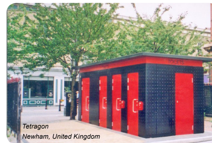
Tetrakon Newham, United Kingdom