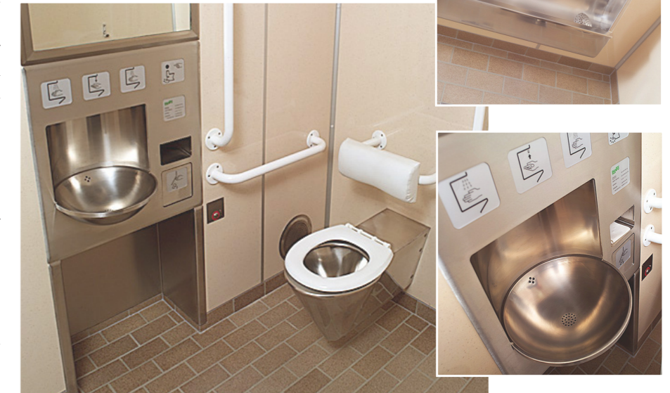
Beispiel eines Beh. WC-Raumes, der immer den jeweils nationalen Richtlinien für Zugang behinderter Personen angepasst wird.

Die mit Laminat bekleideten Wände sind extrem widerstandsfähig. Die hochglänzende Oberfläche bürgt für leichte Reinigung und verleiht dem WC-Raum einen blitzsauberen Eindruck.