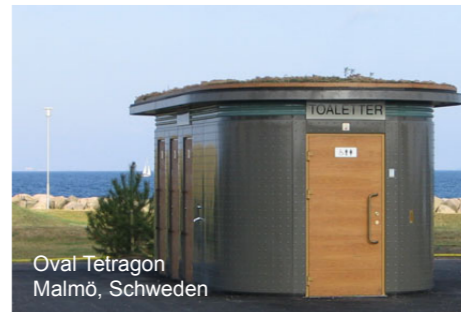
Oval Tetrakon Malmö, Schweden