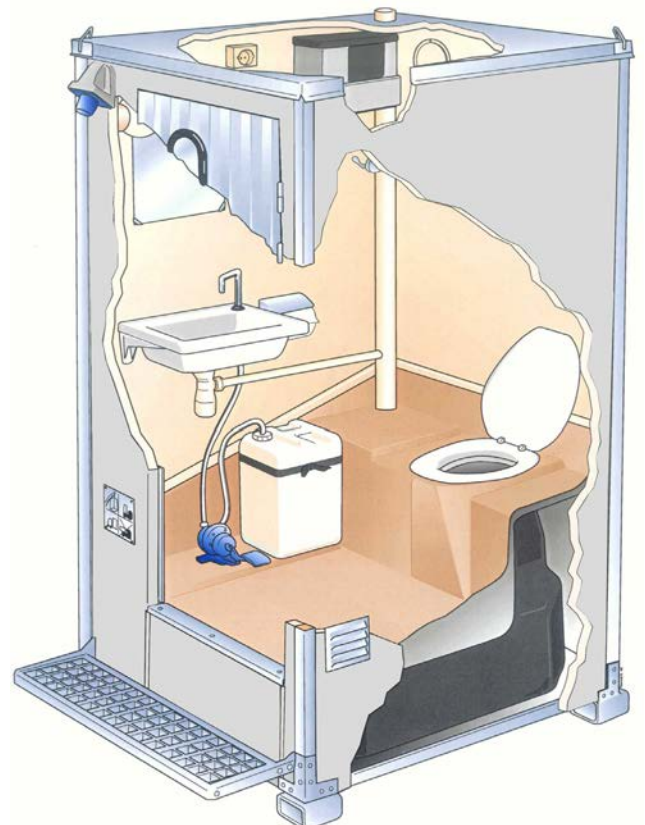
Poikkileikkaus tyypillisestä liikuteltavasta T-500 käymälästä.

Kaikki mallit on helposti kuljetettavissa. Danfon liikuteltavat käymälät soveltuvat niin väliaikaiseen kuin pysyväänkin käyttöön esimerkiksi golf-kentille, leirintäalueille, rakennustyömaille, urheilukentille jne.