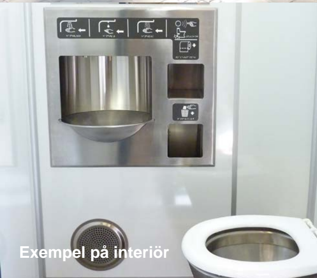
Exempel på interiör