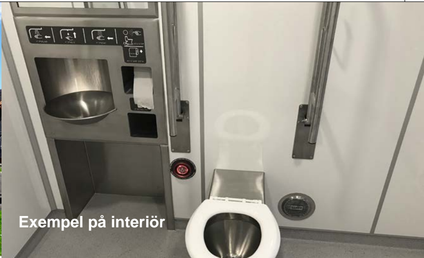
Exempel på interiör