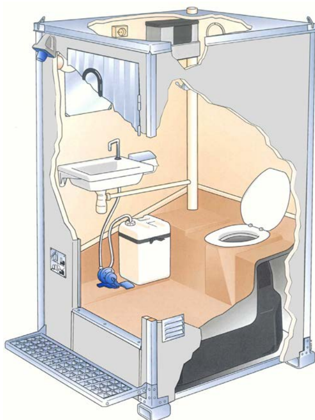
Genomskärning av en Toalettkabin med latrintank.

Alla enheter är lätta att flytta och transportera. Kabinerna kan användas permanent eller periodvis på till exempel golfbanor, campingplatser och arbetsplatser inom bygg- och tillverkningsindustrin.